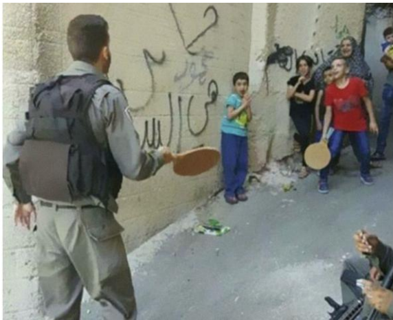
Ένας στρατιώτης που παίζει με παιδιά