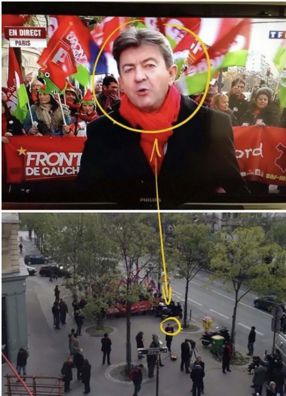
Φορολογική διαμαρτυρία στο Παρίσι