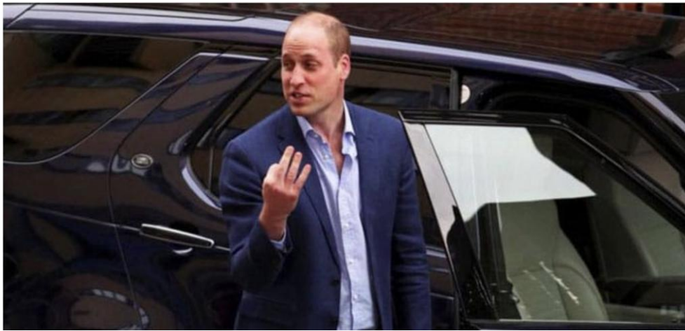
Ο πρίγκιπας Γουίλιαμ από διαφορετικές οπτικές γωνίες.